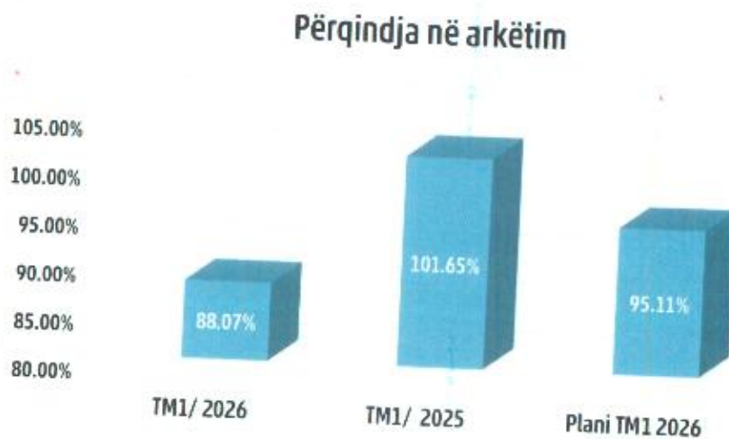
Tabela 11. Paraqitja grafike e përqindjes së arkëtitimit

Përqindja e arkëtitimit nga faturimi për TM1/2026 në krahasim me TM1/2025 ka shënuar ulje për 13.37%, ndërsa realizimi i planit ka arritur në 92.59%.