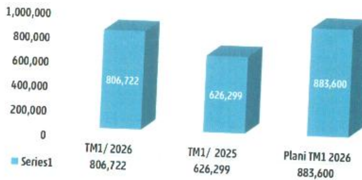
Tabela 10. Paraqitja grafike e arkëtitimit të ujit/€

Arkëtimi i ujit për TM1/2026 në krahasim me TM1/2025 ka shënuar rritje për 28.81 %, ndërsa sa i përket realizimit të planit, është nën plan për 8.70%.