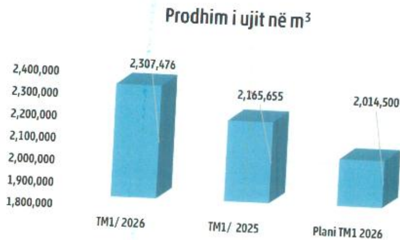
Tabela 7. Paraqitja grafike e prodhimit të ujit në m 3

Prodhimi i ujit në m 3 për TM1/2026 në krahasim me TM1/2025 ka rritje për 6.55%, ndërsa sa i përket arritjes së cakut të planifikuar është tejkaluar për 14.54%.