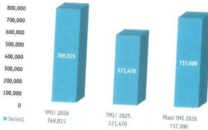
Tabela 12. Paraqitja grafike e shpenzimeve në euro (€)

Shpenzimet në TM1/2026 në krahasim me TM1/2025, kanë shënuar rritje për 34.71%. Ndërsa sa i përket shpenzimeve të parashikuara janë për 4.45% më të larta se planifikimi.